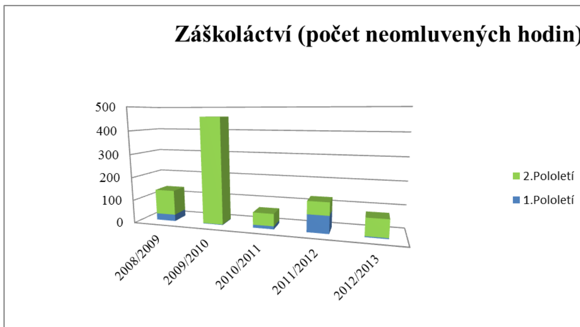
Graf č. 3: Záškoláctví 18